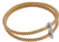
PRIMA TWINS 1,294,700円~