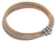
PRIMA AURA 2,031,700円~

1929年、イタリア・ヴィチエンツァで創業したFOPEは、金細工の伝統と革新を融合させながら進化を続けてきました。ブランドを象徴するノヴェチェントのK18 ゴールドメッシュチェーンは、繊細な編み目が生み出す柔らかな光沢で、手元にエレガントな存在感を添えます。さらに独自技術「Flex'it (フレジット)」構造により、留め具を必要としないブレスレットは軽やかにフィットし、日常から特別なシーンまで装いを美しく彩ります。タイムレスな美しさと心地よい着け心地を備えたFOPEのジュエリーをお楽しみください。