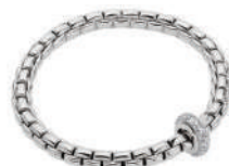
EKA ICE 2,762,100円~